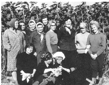
Во время учета урожая подсолнечника. 24 августа 1967 г.

несколько сдвинуто в сторону увеличения легкоподвиж-