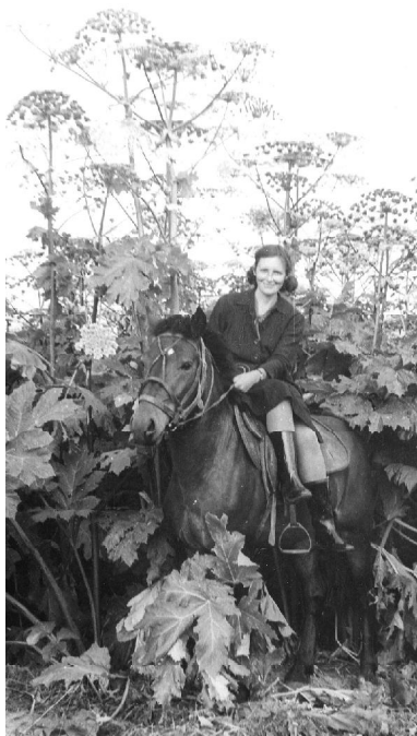
В зарослях борщевика Сосновского.

учную деятельность в Коми филиале АН СССР. Они остановили свой выбор на изучении влияния агротехнологий на продуктивность фотосинтеза посевов. Много внимания уделялось теплолюбивым культурам (томаты, кукуруза) и высокопродуктивным кормовым растениям, завезенным на Север из других климатических зон (борщевика, силосные сорта подсолнечника). Погодно-климатические условия нашего региона часто оказывались для интродуцентов пессимальными и они гораздо заметнее реагировали на их малейшие изменения по сравнению с местными растениями, что позволяло лучше понять закономерности продукционного процесса не только новых, но и стародавних культур (ячмень, клевер, картофель). Надо сказать, что к началу 50-х годов прошлого столетия вопрос о механизмах продукционного процесса агроценозов был «белым пятном» физиологии растений. Лишь в 1954 году появилась первая монография А.А. Ничипоровича, посвященная продуктивности фотосинтеза. В этой работе излагались подходы к изучению проблемы, методы исследования.