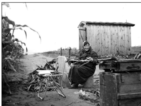
Полевая лаборатория физиологов растений. 1957-1975 гг.