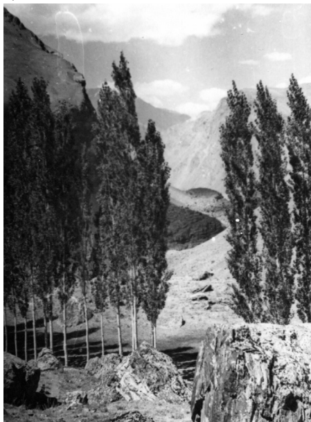
Хорог. Аллея Ботанического сада