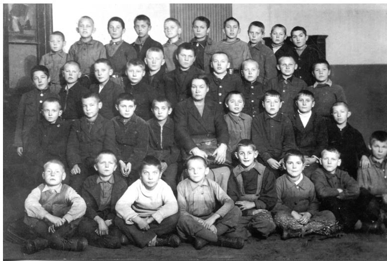
Отряд московской эвако-школы, 1941 год

один или два даже из седьмого класса. Моей обязанностью было следить за поведением во время еды три раза в день, стараться бороться с их вшами и занимать их какими-нибудь делами или рассказами. Группа была смешанной – несколько обычных «Тимирязевских» ребят и трое шпанистых, игравших роль главарей, обижавших одного явно недоразвитого, полноватого и болезненного подростка. Я воспитывала их своеобразно – называла дураками и недоумками тех, кто на соседних огородах добывал еду, хотя безопаснее было бы (не поймают и не нажалуются хозяева огородов) делать это на другом берегу Оки, ведь плавать ребята умели. А еще говорила «главарю», что раз ребята его слушаются, пусть бы он последил, чтобы другие не обижали «толстяка». Это подействовало.