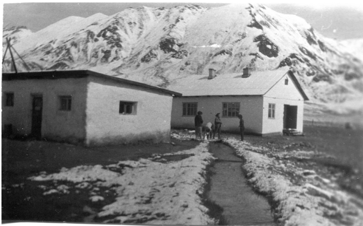
Февраль 1943 года на Биостанции