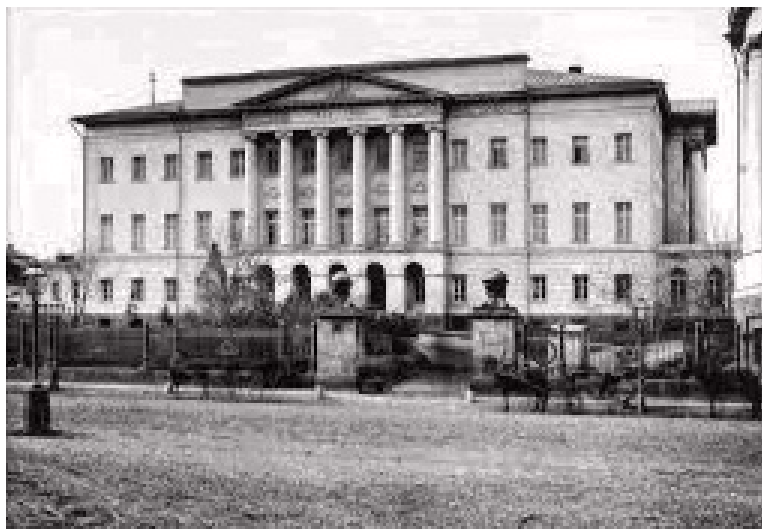
Старое здание МГУ на Моховой улице