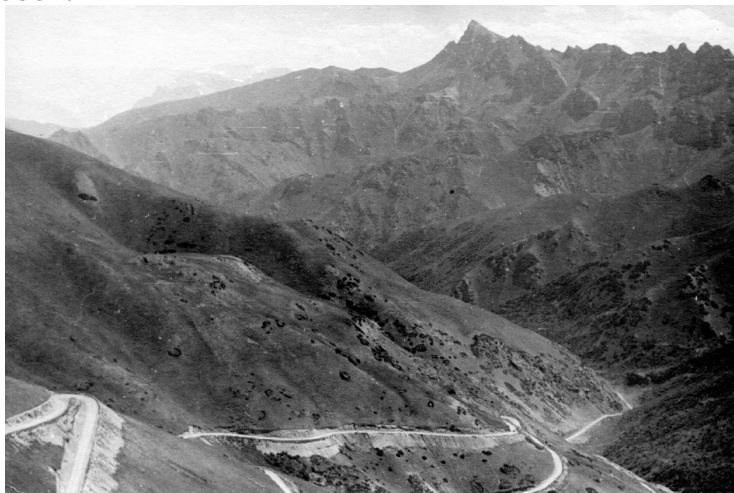
Восточный Памир. Дорога в Чечекты

горной породы. На этом пути видны горы конусообразной формы – это четыре брата – они очень схожи между собой.