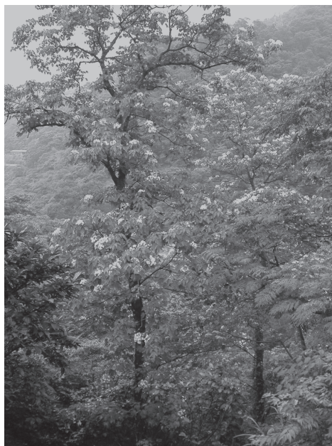
Масляное дерево (тунг)

В Западной Грузии для тунга наиболее близкие условия к местам его естественного произрастания. Но заняли посадки тунга площади, так же благоприятные и для цитрусовых. Это не вызвало доброго отношения к тунгу местного населения, которое должно было ухаживать за ним. В 1944 году в плантации «моего» совхоза тунги представляли собой деревья высотой около 10–15 метров. Их плоды размером с небольшой грецкий орех висят гроздьями на концах побегов. Рос тунг сравнительно недалеко от домов совхоза, но его плантации заросли кустами и высокой травой, где прекрасно себя чувствуют змеи – гадюки. А близость территории совхоза к Колхидской низменности способствует изобилию малярийных комаров.