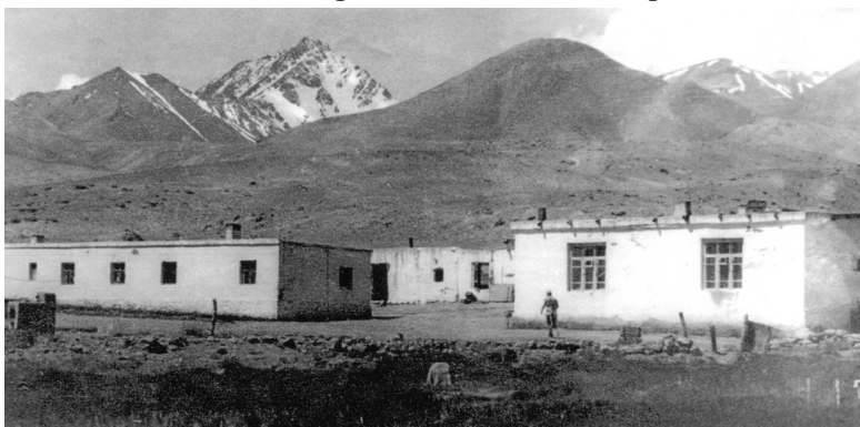
Вид Памирской биостанции в военные годы