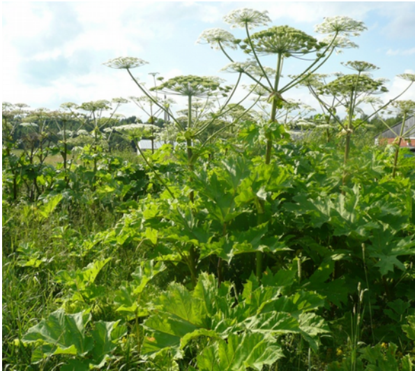
Заросли борщевика Сосновского в городской черте

Борщевик Сосновского ( Heracleum sosnowskyi Manden.) – крупное травянистое растение, способное вызывать у человека ожоги. Часто эти растения формируют значительные по площади сплошные заросли.