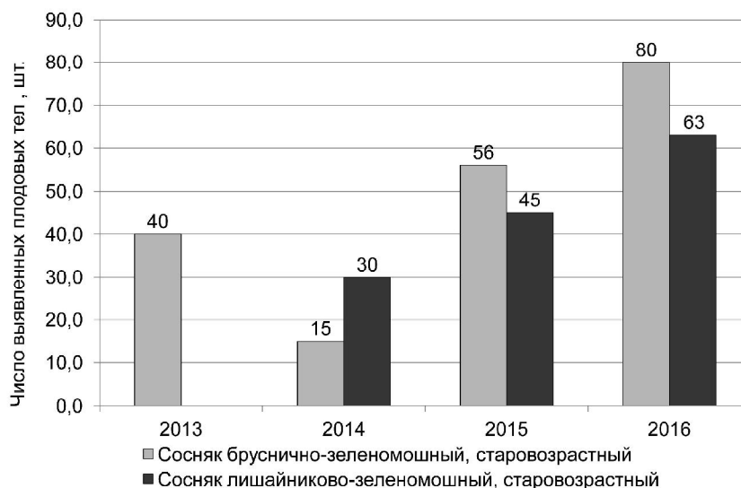
Рис. 4. Динамика изменения продуктивности S. cornucopioides на мониторинговых площадках в заказнике «Важъелью» в 2013-2016 гг.

В результате проведенных исследований получены новые данные о видовом составе биоты редких макромицетов, обитающих в окрестностях г. Сыктывкара. Выявлены новые точки их распространения, проведены многолетние наблюдения за продуктивностью и дана оценка жизнеспособности как для отдельных грибных организмов, так и для популяций в целом. Состояние большинства популяций можно охарактеризовать как удовлетворительное – они имеют широкое распространение по территории, слагающие их грибные организмы не угнетены и регулярно образуют плодовые тела. Существование в условиях повышенной антропогенной нагрузки, которая характерна для всех пригородных экосистем, оказывает влияние на исследованные виды, но не имеет критического значения. Полученные