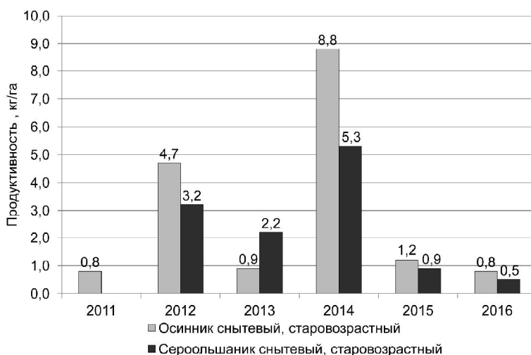
Рис. 2. Динамика изменения продуктивности V. bohemica на мониторинговых площадках в заказнике «Сыктывкарский» в 2011-2016 гг.

Паутинник фиолетовый – ( Cortinarius violaceus ), представитель сем. Cortinariaceae. Вид занесен в Красную книгу Республики Коми (2009) – категория статуса редкости 3. Плодовые тела вида выявлены на территории трех модельных участков (табл. 1). На данный момент известно 10 местонахождений C. violaceus . Все находки – новые для территории Республики Коми. Относительно крупные территориальные группировки отмечены на участках «Важъелью» (четыре точки суммарной численностью в 10 плодовых тел) и «Лозым» (пять точек, 26 плодовых тел). Значительная территориальная удаленность отдельных точек друг от друга позволяет рассматривать каждую точку как отдельную ценопопуляцию, которая, как показывают данные наблюдений за плодообразованием вида, представлена единичным грибным организмом. Этот факт важно учитывать при организации охраны вида. Многолетний мониторинг за продуктивностью C. violaceus на отдельных точках показал наличие стабильного ежегодного плодообразования, интенсивность и размах колебаний которого соответствует биологическим особенностям данного вида (рис. 3). Опираясь на результаты наблюдений, можно оценить состояние всех известных ценопопуля-